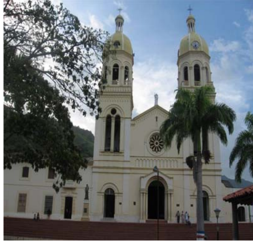
Suelo urbano municipal de Gramalote e Iglesia principal