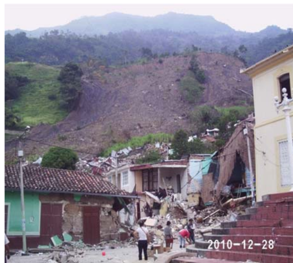
Sectores del suelo urbano municipal de Gramalote

En el momento del desastre no se presentaron víctimas mortales. Las alertas se dispararon en el momento oportuno y se logró evacuar a la población, mediante un proceso efectivo interinstitucional y con la colaboración de la comunidad afectada.