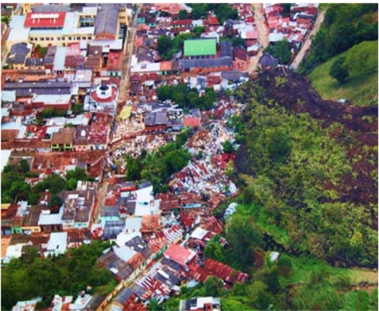
Suelo urbano municipal de Gramalote e Iglesia principal