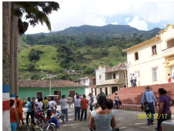
Sector del suelo urbano municipal de Gramalote